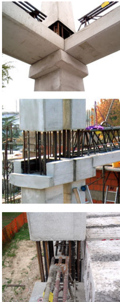
Fig. 3 - Particolari dell'appoggio delle travi PREM ai pilastri.