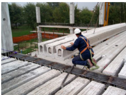
Fig. 9 - Posa del solaio alveolare.

Dopo la posa del solaio alveolare è stato eseguito il getto di completamento, in unica soluzione per le travi, i pilastri e i solai, rendendo così la struttura iperstatica come da ipotesi progettuale.