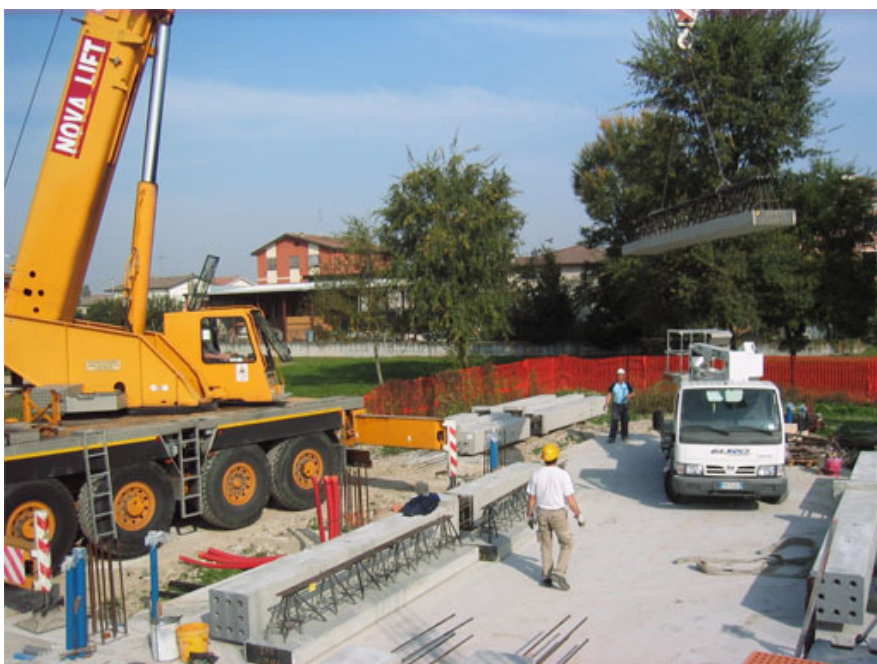
Fig. 1 - Vista del cantiere.

Non mancheranno alcuni approfondimenti sulle modalità di gestione del cantiere e su alcune particolarità operative.