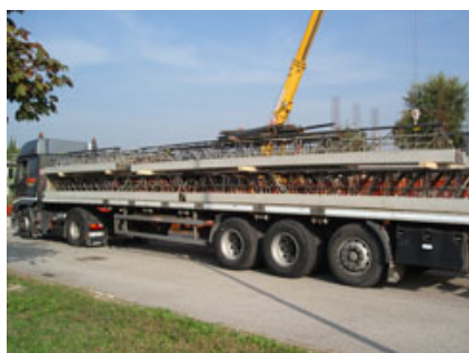
Fig. 12-13 - Scarico e movimentazione delle travi PREM.