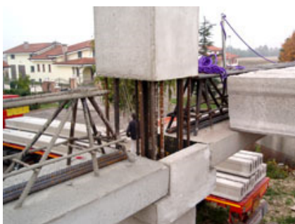
Figg. 7-8 - Fasi di posa del solaio alveolare.