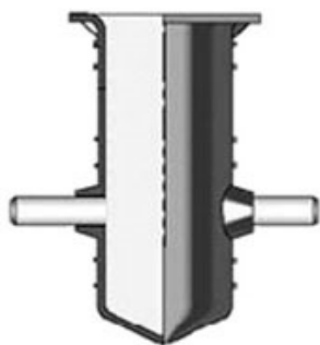
Fig. 14 - Boccola per l'installazione delle linee vita.

Per ulteriori specifiche rimandiamo alla newsletter 29 .