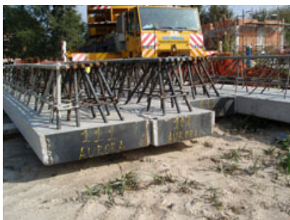
Fig. 4 - Travi PREM stoccate in cantiere.

Grazie alle mensole dei pilastri è stato possibile progettare l'armatura longitudinale inferiore e il montante obliquo delle travi in modo da farli terminare in corrispondenza del termine dello zoccolo in cls, ottenendo quindi una semplificazione delle operazioni da eseguire nelle fasi di posa in opera e una riduzione delle tempistiche di cantiere.