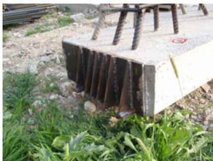
Fig. 15-16 - Boccole annegate nello zoccolo delle travi PREM (anelli di colore rosso).