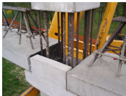
Figg. 5-6 - Particolari di appoggio delle travi PREM ai pilastri BAUTEC pluripiano. Si notino le mensole dei pilastri, già predisposte in fase di produzione.