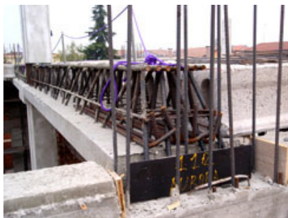
Fig. 10-11 - Vista del primo impalcato.