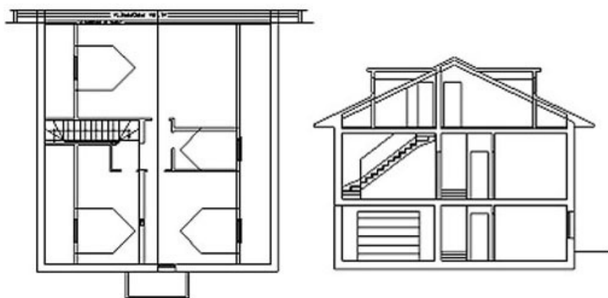
Fig. 2 - Pianta del sottotetto e sezione dell'edificio.

Il sistema Prepanel® ha permesso, grazie alle sue peculiarità di struttura mista, di costruire dei pannelli "a ginocchio", appoggiati da un lato alla trave Wood Beton® e dall'altro al cordolo perimetrale, andando a coprire così entrambe le falde.