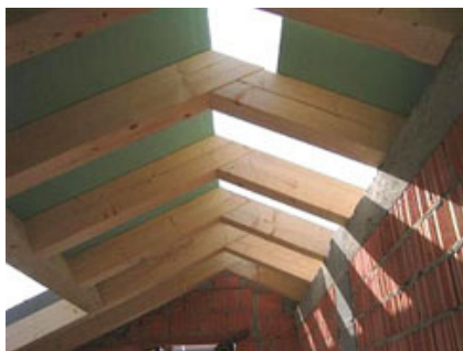
Fig. 3 - Appoggio dei pannelli in corrispondenza del colmo.