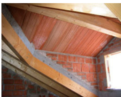
Fig. 8 - Completamento in opera degli abbaini.

Questa soluzione, contrariamente a quanto ci si aspetterebbe, non ha richiesto particolari accortezze di posa, se non dovute al peso dei pannelli stessi che risultava considerevole vista la lunghezza di falda. I pannelli sono stati composti in stabilimento con travetti di sezione 12x18 cm in legno bilamellare. Nell'interasse tra i travetti è stato costruito il pacchetto di copertura che prevede l'interposto (in questo caso è stato utilizzato il cartongesso, una soluzione di notevole interesse estetico) e la presenza di 5 cm di polistirene. Il tutto è stato completato con il getto della cappa di 5 cm di calcestruzzo alleggerito, con Rck 200 Kg/cm 2 , armato con rete elettrosaldata a maglie 20x20 cm e portato a solidarizzare con i travetti in legno attraverso i fori in questi ultimi. La struttura base di sostegno degli abbaini, poi completati dalla committenza, è stata realizzata in travetti WoodBeton® posizionati usando come registro i pannelli già posati, in modo da avere complanarità con la falda della copertura. Questo per ottenere, una volta eseguito il getto di completamento in questi spazi, una situazione finale consimile a quella del pannello Prepanel® realizzato in stabilimento (fig. 7).