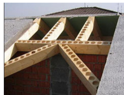
Fig. 7 - Struttura dell'abbaino in opera.