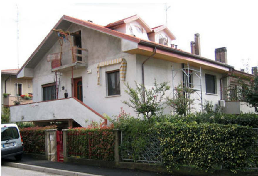
Fig. 1 - Vista d'insieme dell'intervento.

Grazie al Prepanel® la posa della copertura è infatti stata completata in soli due giorni.