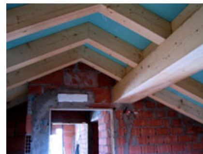
Fig. 5 - Trave Wood Beton posata.