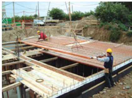
Fig. 2 - Fase di posa in opera del solaio uniSOL®.