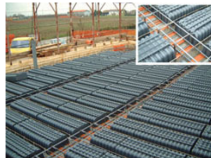
Fig. 3 - Vista del solaio alleggerito con geoSOL® e particolare della correa di ripartizione.