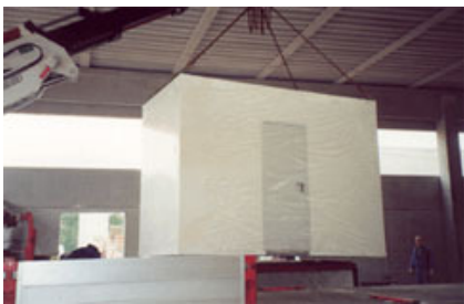
Fig. 8 – Movimentazione di una cellula bagno.