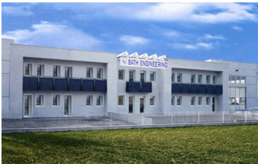
Fig. 1 – La sede di Bath Engineering di Asoło (TV).

Per chi fosse interessato ad avere il manuale tecnico in formato cartaceo sarà sufficiente contattare direttamente l'azienda o Comet Commerciale ai numeri elencati alla fine di questo articolo.