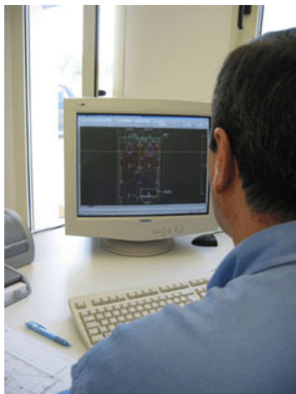
Fig. 6 – Progettazione di una cellula bagno.