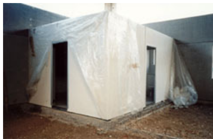
Fig. 9 – Posa di una cellula bagno.