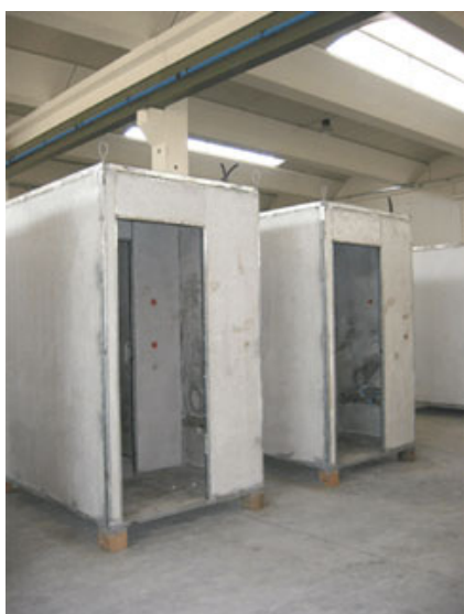
Fig. 3 – Cellule bagno stoccate in stabilimento.