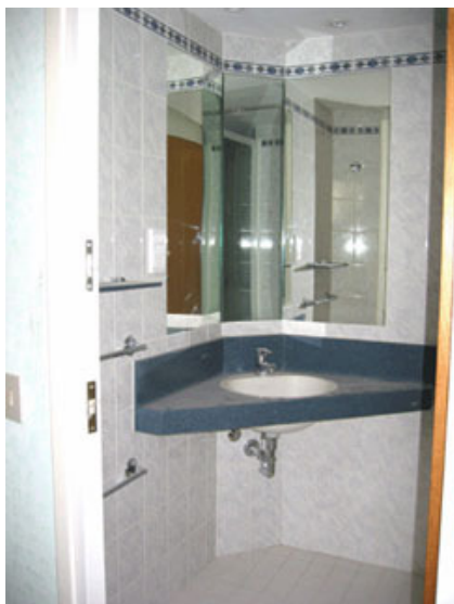
Fig. 5 – Rivestimento interno di una cellula bagno.

Ovviamente i relativi sifoni di scarico sono sempre ispezionabili, siano essi metallici che in PVC.