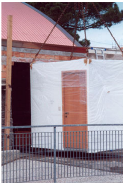
Fig. 7 – Fase di montaggio di una cellula bagno.

L'inizio delle forniture delle cellule bagno CLS saranno sempre precedute dall'arrivo in cantiere di un tecnico. Durante la visita tutte le modalità delle varie fasi di posa in opera saranno illustrate e vagliate. Successivamente il tecnico della Bath Engineering presenzierà alle prime operazioni di scarico, stoccaggio o messa in opera delle cellule bagno.