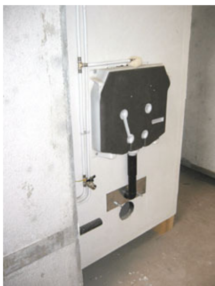
Fig. 4 – Particolare dell'impianto di una cellula bagno.